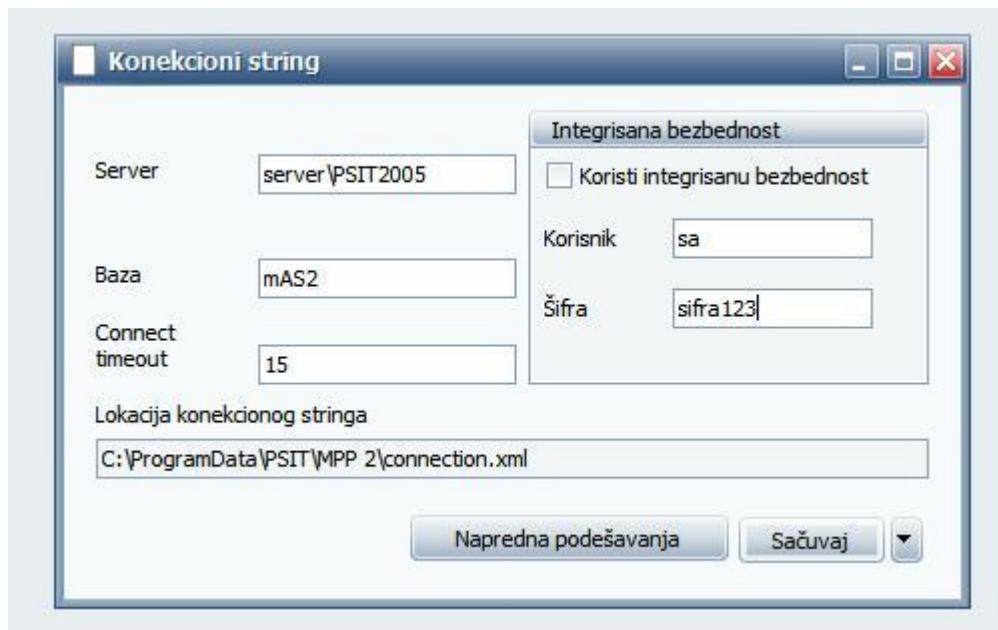
Slika 2 – MPP2–Administracija, forma za definisanje parametara povezivanje